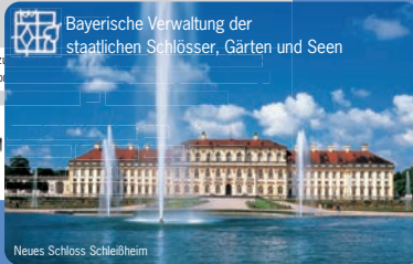
Neues Schloss Schleißheim