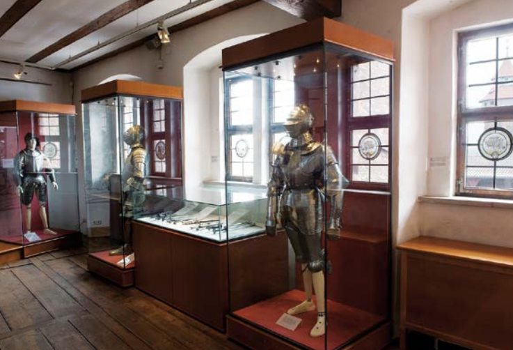
Vista nelle sale della mostra nelle 'Kemenate'