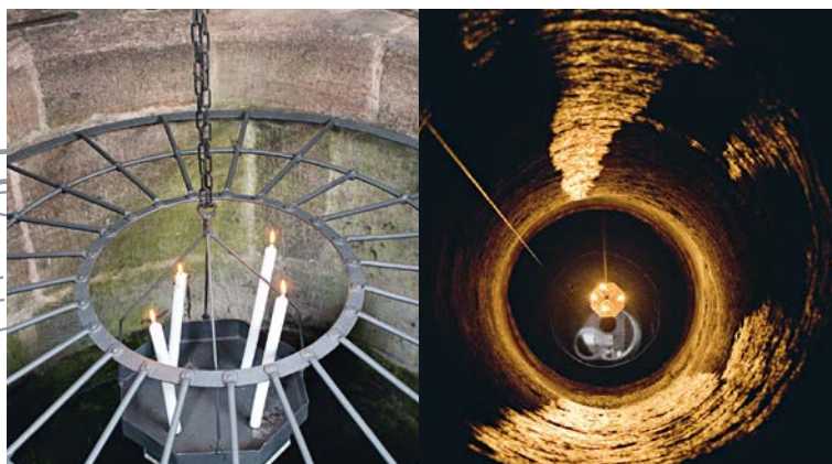
Vista nella cavità del Pozzo profondo

Il Pozzo profondo al centro della fortificazione esterna fu costruito, per l'approvvigionamento idrico autonomo, forse già nella prima fase di costruzione del castello. La sua cavità è scavata per circa 50 metri nella roccia. Una carrellata filmata e un'illustrativa visita guidata permettono ai visitatori di apprezzarne la profondità.