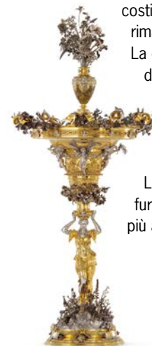
Sigillo della Bolla d'oro (replica), Monaco di Baviera, Bayerisches Hauptstaatsarchiv (in alto); Centrotavola Merkel, Museen der Stadt Nürnberg (al centro); Boccale con l'aquila imperiale, XVII secolo (destra)