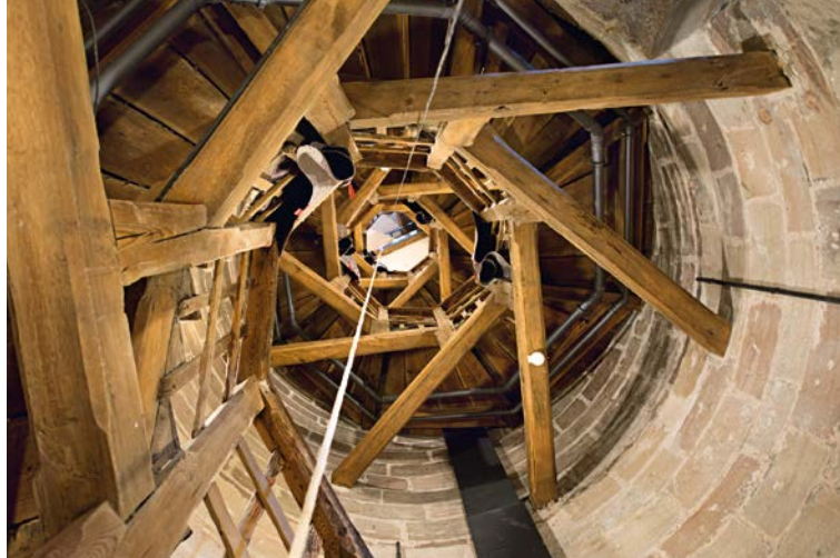
Vista sulla scala della Torre 'Sinwell'