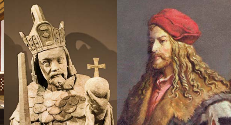
L'imperatore Carlo IV (sin.); Albrecht Dürer (ds.)