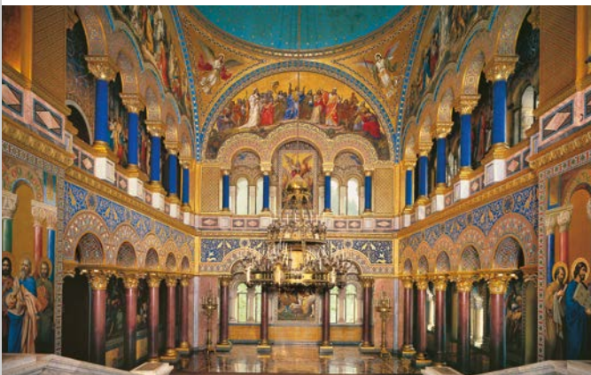
La salle du Trône du château de Neuschwanstein

Des tentures inspirées de légendes nordiques et chevaleresques agrémentent les intérieurs. La salle des Chantiers s'inspire de deux salons du château de Wartburg, tandis que la salle du Trône, qui glorifie la monarchie, rappelle les églises byzantines et paléochrétiennes.