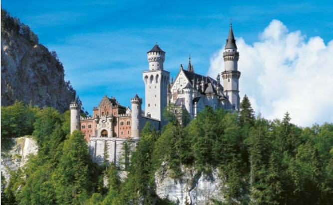
Le château de Neuschwanstein