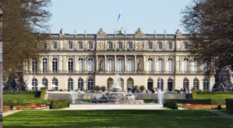
Le château de Herrenchiemsee (Nouveau château)