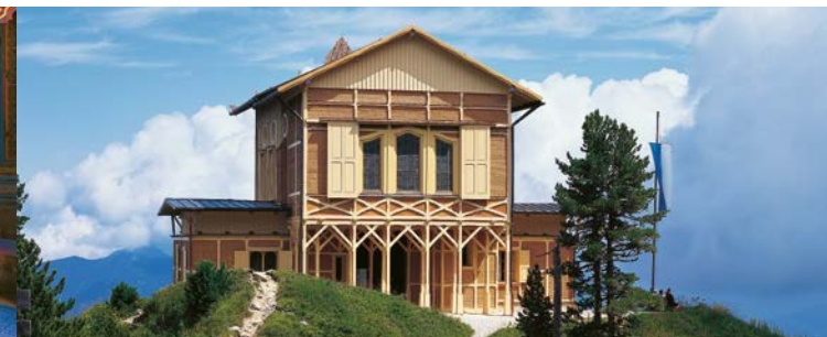
La maison royale de Schachen

C'est dans un site grandiose, à 1800 m d'altitude et avec le massif du Wetterstein en arrière plan, que le roi Louis II fit construire ce petit château. Alors que la façade et l'aménagement intérieur du rez-de-chaussée sont d'apparence modeste, le salon turc du premier étage se distingue par son luxe oriental intégrant une fontaine et des divans. Le roi aimait fêter son anniversaire et son saint patron dans ce pavillon isolé, accessible uniquement à pied à partir d'Elmau, Mittenwald ou Garmisch-Partenkirchen.