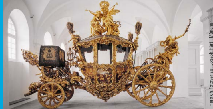
Carrosse d'apparat de Louis II exposé au Marstallmuseum

Bayerischer Staatsminister der Finanzen und für Heimat