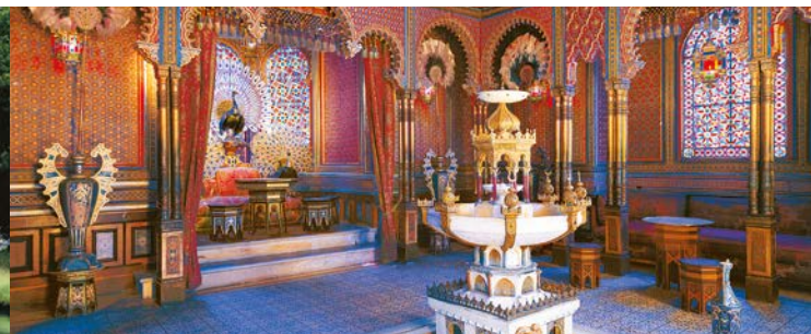
Le kiosque mauresque de Linderhof

XIX e siècle, regroupe des éléments baroques, notamment de magnifiques plans d'eau, et d'autres de style naturaliste, typiques des jardins à l'anglaise. Il abrite aussi divers bâtiments remarquables, tels que la maison marocaine, le kiosque mauresque et la grotte de Vénus, aménagée d'après les indications de Richard Wagner pour le 1 er acte de l'opéra Tannhäuser . On trouve encore dans le parc deux décors conçus pour les drames musicaux de Wagner : quant à la chaumière de Hunding et à l'ermitage de Gurnemanz, ils servirent de décors pour le premier acte des Walkyries et le troisième acte de Parsifal. Notons pour terminer que Linderhof était la résidence préférée de Louis II.