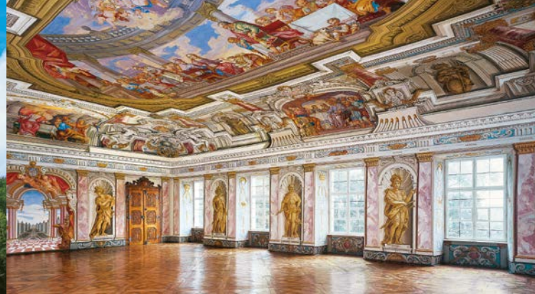
Salle impériale baroque du couvent des chanoines augustins