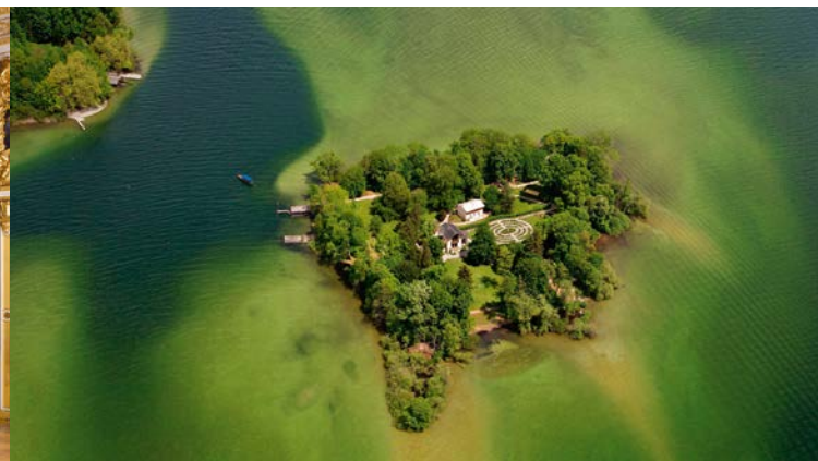
L'île des Roses entourée de bas-fonds

Sur la rive est du lac, à proximité du château de Berg, se trouve une chapelle votive construite près du lieu où le roi Louis II fut retrouvé mort le 13 juin 1886.