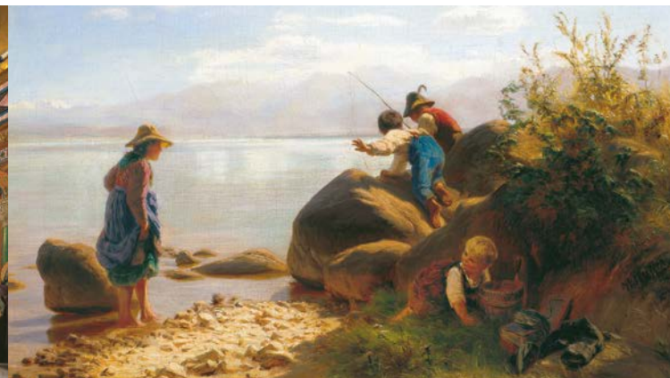
'Enfants pêchant au bord du Lac de Chiemsee', F. W. Pfeiffer

Après que Louis II eut acheté l'île de Herrenchiemsee en 1873, il fit aménager des appartements dans l'ancien couvent et s'y installa durant la construction du Nouveau château, appelé ainsi par opposition au couvent, qualifié pour sa part de Vieux château. C'est en ce lieu que se réunit, en 1948, les membres de la convention chargée d'élaborer la Constitution de la future République fédérale d'Allemagne. L'ancien couvent abrite par ailleurs une collection de tableaux des « peintres du Chiemsee », notamment Julius Exter.