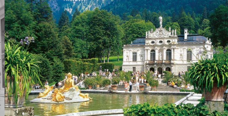
La façade principale du château de Linderhof