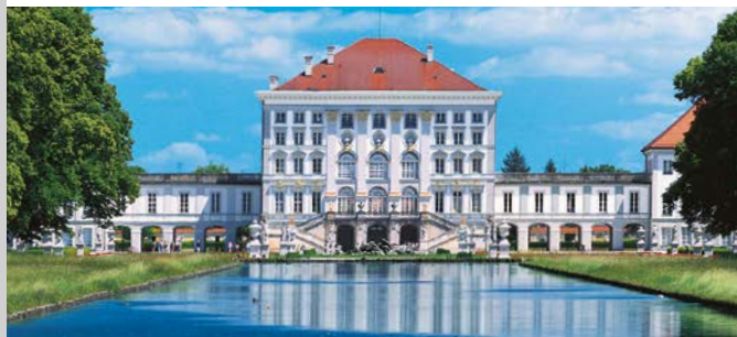
Le château de Nymphenburg

et carrosses rassemblée par les Wittelsbach sur une période de plus de trois siècles. Le roi utilisait ces véhicules surtout pour des sorties nocturnes, ce qui suscitait l'admiration des rares personnes qu'il rencontrait. Une ampoule électrique éclairait déjà la couronne royale flanquée d'angelots qui agrémentent le traîneau et les carrosses avaient déjà des ressorts à lames semblables à ceux employés sur les automobiles quelques années plus tard. Cette association d'un style ancien et de techniques plus modernes est typique de l'époque. La collection de harnais et de selles d'apparat datant de l'époque du roi Louis II inclut de superbes pièces parfaitement conservées, notamment des ornements textiles tels que des glands et des rosettes.