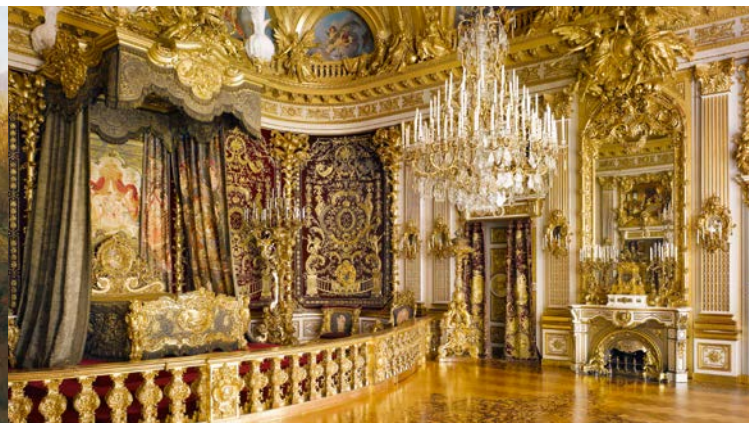
La chambre d'apparat du château de Herrenchiemsee

Le bâtiment et son parc ne furent toutefois jamais terminés. Les plans prévoient de réaliser un magnifique parterre d'eau, similaire à celui de Versailles et qui aurait dû couvrir la quasi-totalité de l'île. Aujourd'hui, le Nouveau château est entouré d'un parc naturel et de biotopes importants. Il abrite par ailleurs un musée consacré à la vie et à l'œuvre de Louis II, souverain que Paul Verlaine qualifia en 1886 de « seul vrai roi du XIX e siècle ».