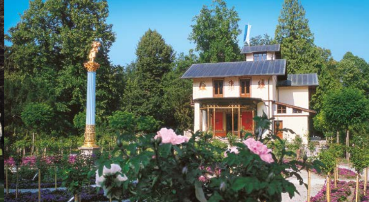
La roseraie à l'est du casino