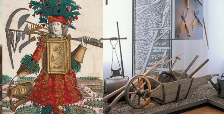
Kupferstich und Gartenwerkzeuge aus dem Museum