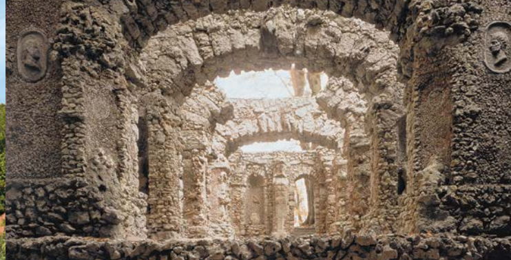
Felsengarten Sanspareil: Bühne des Ruinentheaters