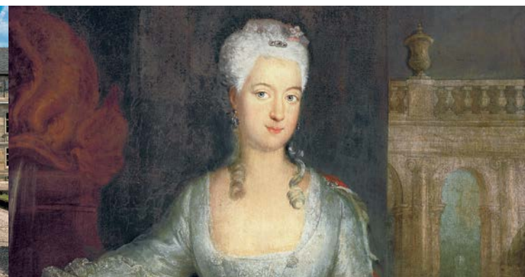
Markgräfin Wilhelmine, Werkstatt Antoine Pesne, um 1734

Braunschweig-Wolfenbüttel, das zunächst frei stehende Italienische Schlässchen errichten. Wenig später wurde dieses mit dem Südflügel des Neuen Schlosses verbunden. Der Grotte-trakt leitet inhaltlich und architektonisch zum Hofgarten über. Im Neuen Schloss befinden sich neben den Prunkräumen verschiedene Dauerausstellungen: Die »Bayreuther Fayencen – Sammlung Rummel«, die Zweiggalerie der Bayerischen Staatsgemäldesammlungen mit Werken des Spätbarock und die »Miniaturensammlung Dr. Löer« mit galanten und erotischen Miniaturen des 18. Jahrhunderts. Nach dem Bau des Neuen Schlosses erfuhr auch der Hofgarten eine Umgestaltung und Erweiterung. Die 1679 gepflanzte Mailbahn-Allee (Mail war ein mit Croquet vergleichbares Spiel) wurde in die Neuanlage mit einbezogen. Südlich davon ließ das Markgrafenpaar Alleen, Heckenquartiere, Laubengänge und Parterres anlegen. Ende des 18. Jahrhunderts wurde die Anlage in einen Park nach »Engelländischer Art« mit sich schlängelnden Wegen und freien Pflanzungen umgewandelt. Die Grundzüge des geometrischen Gartens, mit dem Kanal und drei Hauptalleen, sind heute noch erkennbar. Das Parterre vor dem Südflügel wurde 1987 rekonstruiert.