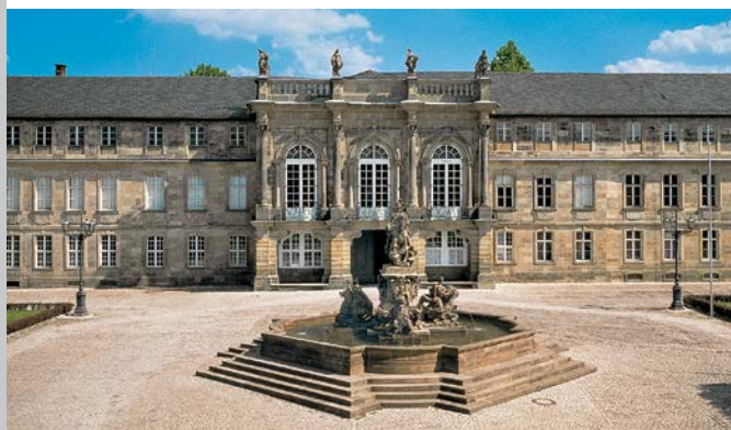
Neues Schloss Bayreuth mit Markgrafen-Brunnen

Braunschweig-Wolfenbüttel, das zunächst frei stehende Italienische Schlässchen errichten. Wenig später wurde dieses mit dem Südflügel des Neuen Schlosses verbunden. Der Grotte-trakt leitet inhaltlich und architektonisch zum Hofgarten über. Im Neuen Schloss befinden sich neben den Prunkräumen verschiedene Dauerausstellungen: Die »Bayreuther Fayencen – Sammlung Rummel«, die Zweiggalerie der Bayerischen Staatsgemäldesammlungen mit Werken des Spätbarock und die »Miniaturensammlung Dr. Löer« mit galanten und erotischen Miniaturen des 18. Jahrhunderts. Nach dem Bau des Neuen Schlosses erfuhr auch der Hofgarten eine Umgestaltung und Erweiterung. Die 1679 gepflanzte Mailbahn-Allee (Mail war ein mit Croquet vergleichbares Spiel) wurde in die Neuanlage mit einbezogen. Südlich davon ließ das Markgrafenpaar Alleen, Heckenquartiere, Laubengänge und Parterres anlegen. Ende des 18. Jahrhunderts wurde die Anlage in einen Park nach »Engelländischer Art« mit sich schlängelnden Wegen und freien Pflanzungen umgewandelt. Die Grundzüge des geometrischen Gartens, mit dem Kanal und drei Hauptalleen, sind heute noch erkennbar. Das Parterre vor dem Südflügel wurde 1987 rekonstruiert.