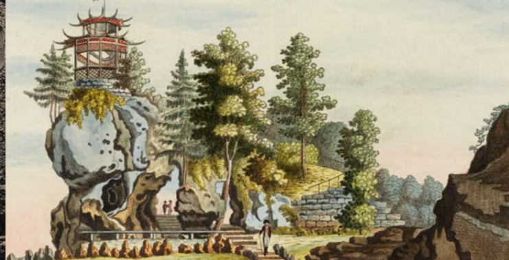
Aeolusgrotte mit Aussichtspavillon, G. Vogel, 1793