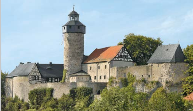
Burg Zwernitz; Abb. Titel: Neues Schloss Eremitage