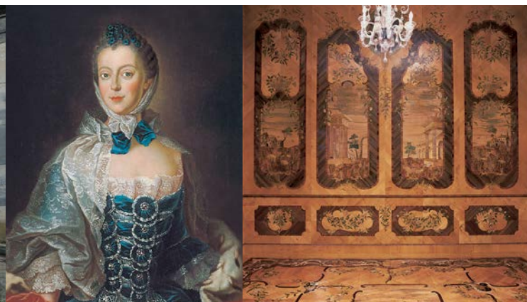
Herzogin Elisabeth Friederike Sophie (li.); Spindler-Kabinett (re.)

Schloss Fantaisie beherbergt seit 2000 das erste Gartenkunst-Museum Deutschlands. Anhand zahlreicher und wertvoller Exponate wird hier die Geschichte der Gartenkunst vom 17. bis zum 19. Jahrhundert anschaulich dargestellt. In den Museumsrundgang eingebunden sind der Weiße Saal sowie die Nachbildung des berühmten Spindler-Kabinetts mit seiner aufwendigen Marketerie. Der reizvolle Schlosspark ist von originalen Gestaltungselementen der drei wichtigen Stilphasen Rokoko, Empfindsamkeit und Historismus geprägt. Er ist wesentlicher Bestandteil des Gartenkunst-Museums Schloss und Park Fantaisie.