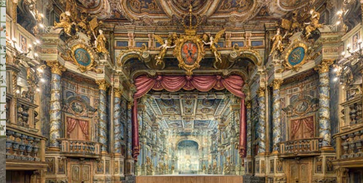
Blick auf die Bühne mit dem rekonstruierten Bühnenbild