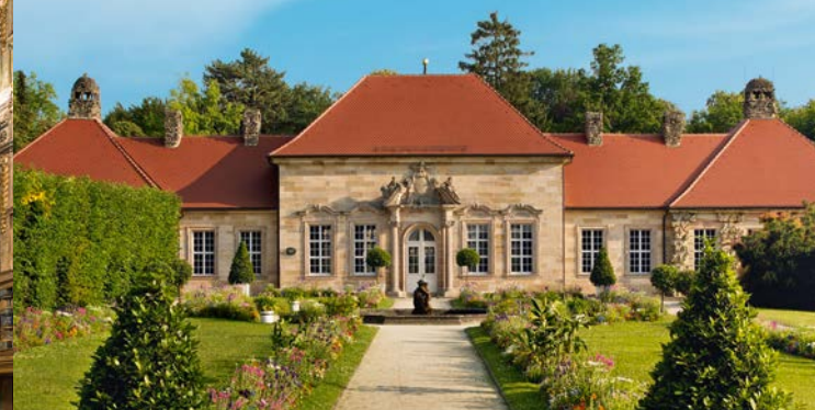
Blick auf das Alte Schloss Eremitage mit Springbrunnen