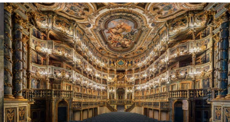
Zuschauerraum mit Blick in Richtung Fürstenloge

Das 1748 eingeweihte Opernhaus gehört zu den eindrucksvollsten Schöpfungen der Festarchitektur des Barock. Vorbild waren die größten Opernhäuser der Zeit in Wien und Dresden. Den Innenraum des ganz aus Holz gefertigten Logentheaters entwarf Giuseppe Galli Bibiena, der bedeutendste Theaterarchitekt seiner Zeit. Die Bauaufsicht vor Ort übernahm sein Sohn Carlo Galli Bibiena, der zahlreiche Bühnenbildentwürfe und Festdekorationen für das Markgräfliche Opernhaus schuf. Auftraggeberin war Markgräfin Wilhelmine, eine Schwester Friedrichs des Großen, die selbst als Autorin, Komponistin und Intendantin der Hofoper tätig war. Anlass für die Errichtung des Theaters war die Hochzeit von Wilhelmines einziger Tochter, Elisabeth Friederike Sophie, mit Herzog Carl Eugen von Württemberg. Die ergänzende interaktive Ausstellung entführt in die Welt des barocken Theaters. Zahlreiche Mitmachangebote, wie eine Bühne mit rekonstruierter barocker Maschinerie, laden zum Ausprobieren ein. Die Ausstellung ist inklusiv nach dem Mehr-Sinne-Prinzip gestaltet.