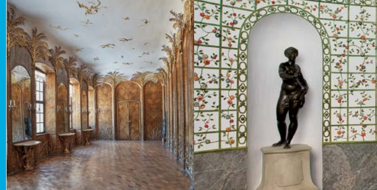
Palmenzimmer (li.); Gartensaal, Italienisches Schlässchen (re.)

Bayerischer Staatsminister der Finanzen und für Heimat